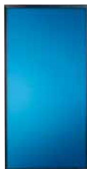
Солнечные коллектора NIBE NIBE Solar FP215 P / PL * Арт. №057001 (P) * Арт. №057002 (PL) (2-3 шт.)