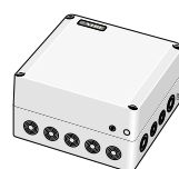
Блок реле солнечного коллектора NIBE SRB22 * Арт. №067109 (1 шт.)