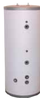
Буферный бак NIBE с солнечным змеевиком NIBE Solar UKVS 230 * Арт. №080320 (1 шт.)